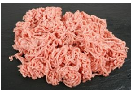
Hakket grisekød 8-12%