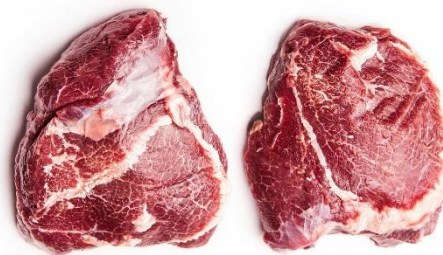
Grise kæbeklump 1 kg