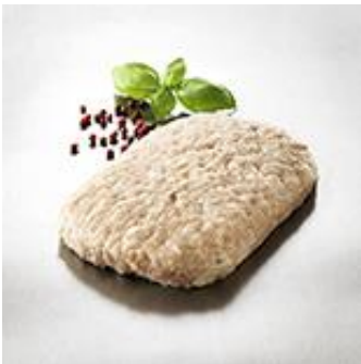
Rørt frikadellefars af grisekød 10-12%

Bestil slagtervarer helt frem til kl. 24 og få leveret næste dag!